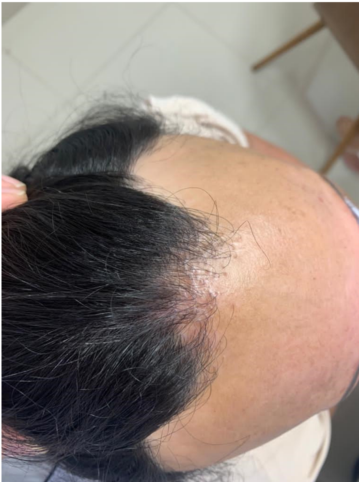
Figura 1. Aspecto clínico da lesão em região frontal.