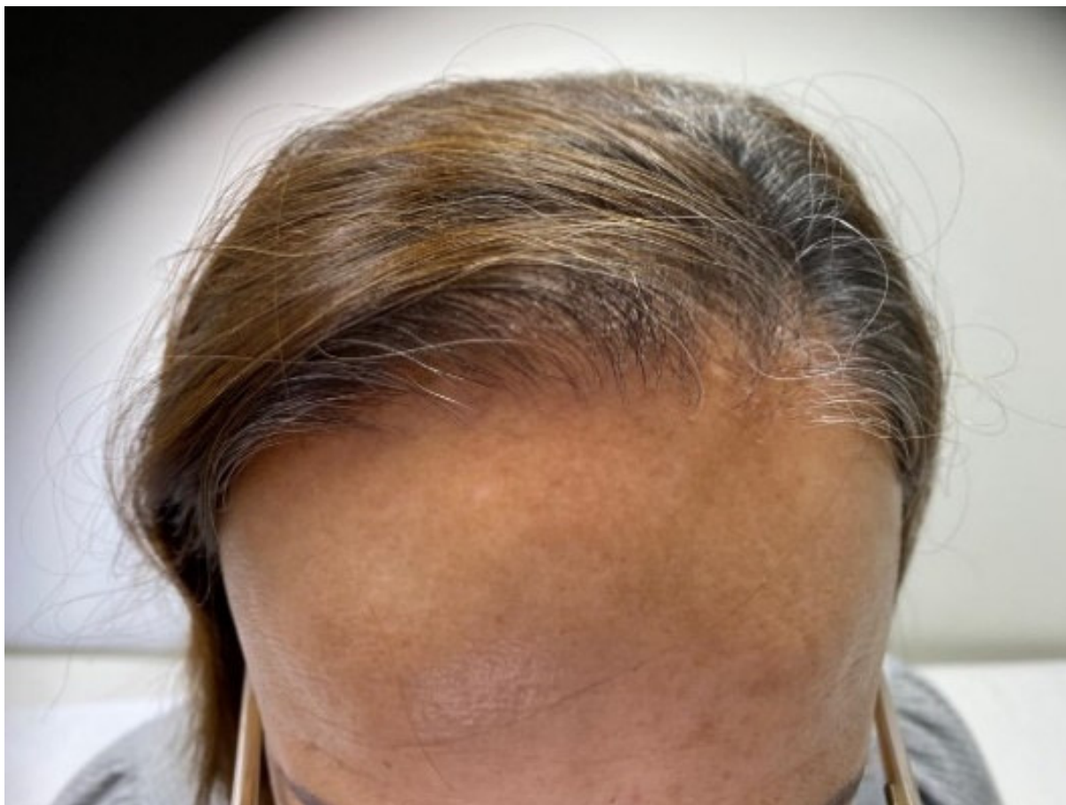
Figura 4. Aspecto clínico da lesão em região frontal.