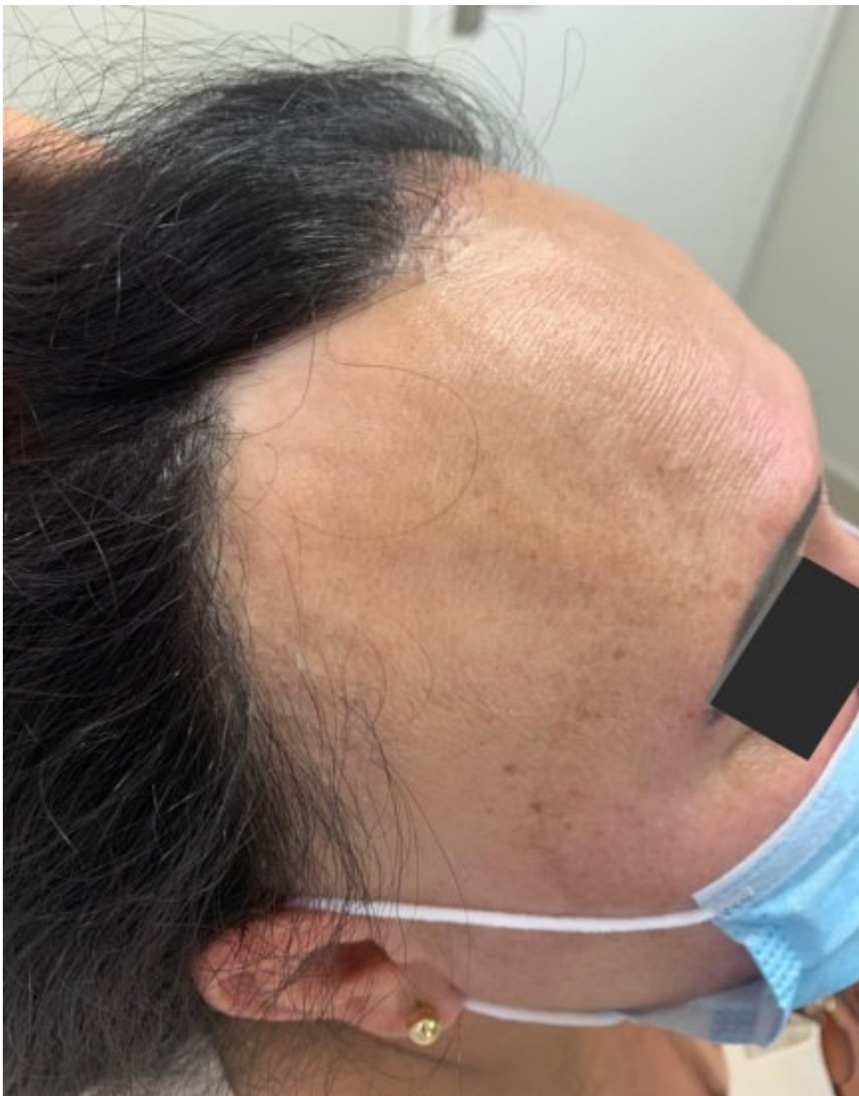
Figura 2. Aspecto clínico da lesão em região temporoparietal.