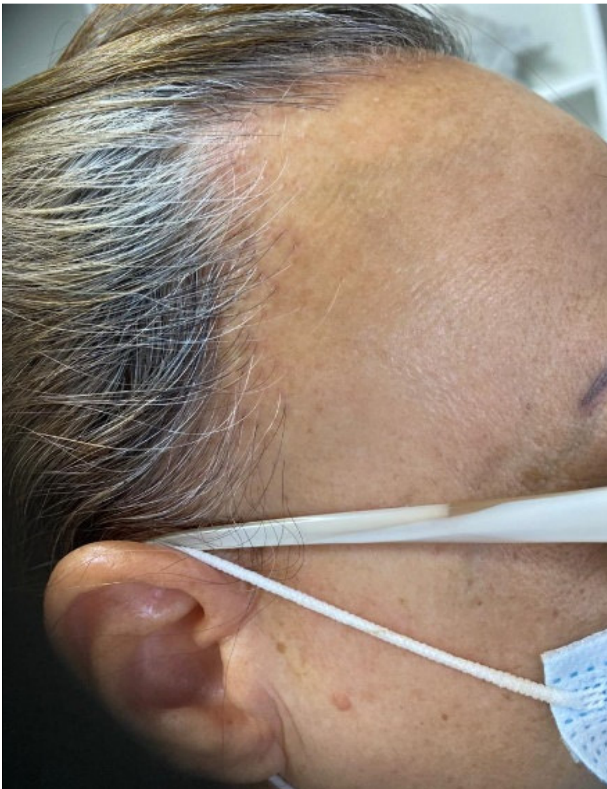
Figura 5. Aspecto clínico da lesão em região temporoparietal.