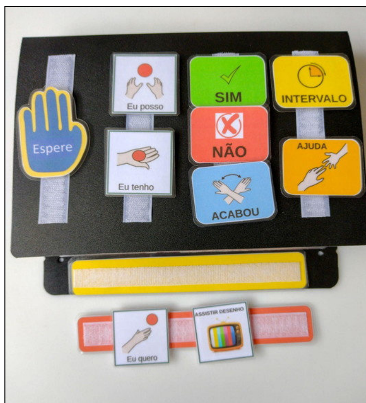
Figura 1. Imagens da pasta de Comunicação Alternativa PECS.

O Picture Exchange Communication System (PECS) é um método da comunicação, da forma funcional de expressar suas necessidades, vontades e escolhas, esse método tem como objetivo atuar em prol do desenvolvimento do TEA (AMARAL et al. , 2012). Esse método é aplicado através da comunicação, e com apoio de material ilustrado, ou seja, com figuras de itens ou ações desejadas pelo profissional que está atendendo o paciente autista, e, sequencialmente, honrar a troca com o paciente. Essa técnica ajuda a criança a compreender e perceber que, através do diálogo comunicativo, ela consegue o que deseja; observe a Figura 1. A importância de se trabalhar essa técnica no tratamento bucal, é ensinar o paciente à comunicação funcional (AMARAL et al. , 2012).